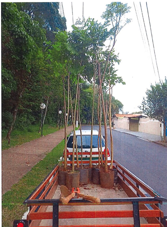
Foto local do Plantio

Associação dos Moradores e Proprietários de Imóveis do Parque Santa Marta